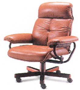
椅子用 Cushion 材

Cosmonate MC-85W 是为适合于 Seat Cushion Foam 制造而开发的特殊液体变性 MDI。它用于对工作效率、造型性和硬度的要求较高的 Cushion Pad,和 Head Rest Pad 制造。它由于硬化性较强广泛用于轿车的 Seat Cushion 材、沙发或椅子的 Cushion 材以及自行车 Pad 制造。